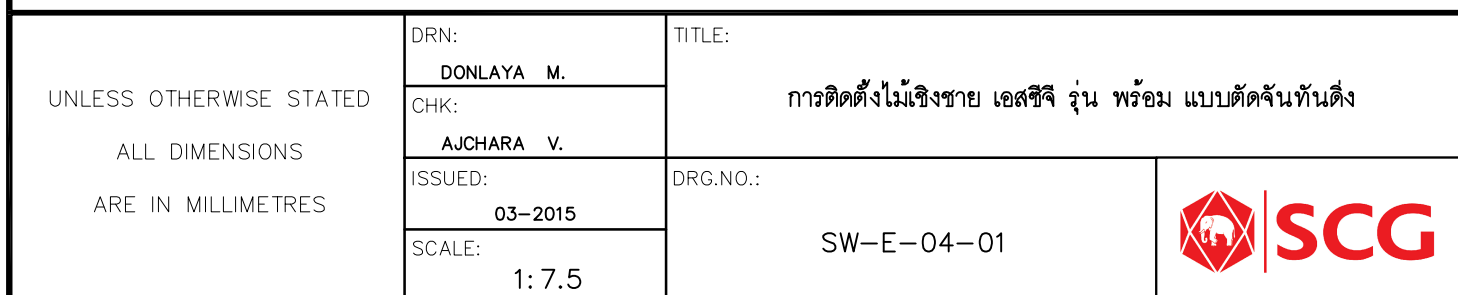
การติดตั้งไม้เชิงชายพร้อม เอสซีจี แบบดิ่ง กับประกับยึดไม้เชิงชาย

เหล็กฉาก 1 1/2 x 1 1/2 นิ้ว หนา 1.6 มม. เชื่อมติดกับจันทันเหล็ก