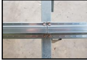
3.2 แบบต่อชนบนหลังจันทัน ความกว้างหลังจันทัน ต้องไม่น้อยกว่า 5 ซม.

หมายเหตุ : เพื่อความแข็งแรงของโครงหลังคา ไม่แนะนำให้ต่อเป็นแนวเดียวกัน (ต่อสลับช่วงจันทันอย่างต่ำแถวเว้นแถว) และห้ามเหยียบรอยต่อแป